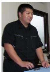
一生懸命作りました！

このニュースレターに「Zoom-Zion」という名前をつけ、発行することを決めました。