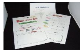
「難加工コンテスト」開催のチラシ

空を見上げたら 空の高いところに ちょっと秋の気配が感じられる そんな季節がやってきました！