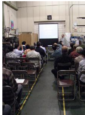
フランソワ・ミレーについて