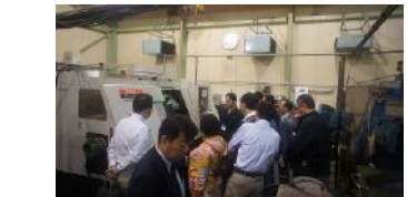
シオン初の「工場見学」開催 2010/10/9