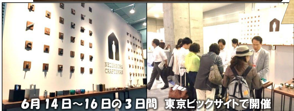
6月14日~16日の3日間 東京ビックサイトで開催

おかげ様で2回目の出展となりました。バイヤー・クリエイターの方々が製品を手にとり興味深げにご覧下さいました。また、「次回も楽しみにしています!」といった声も頂き、ブランドの成長を期待を下さっているんだと感じました。新たな次のステップに踏み出していける力を頂けた展示会となりました。