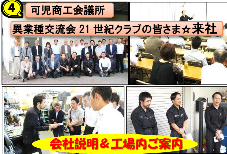
会社説明&工場内ご案内