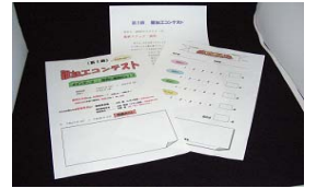
「難加工コンテスト」開催のチラシ

空を見上げたら 空の高いところに ちょっと秋の気配が感じられる そんな季節がやってきました！