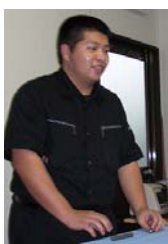
一生懸命作りました！

このニュースレターに「Zoom-Zion」という名前をつけ、発行することを決めました。