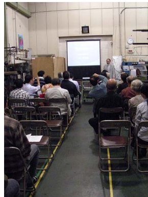
フランソワ・ミレーについて