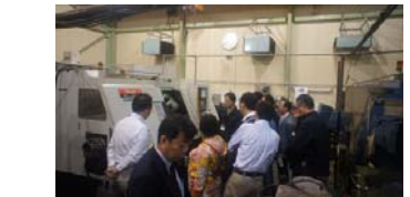
シオン初の「工場見学」開催 2010/10/9