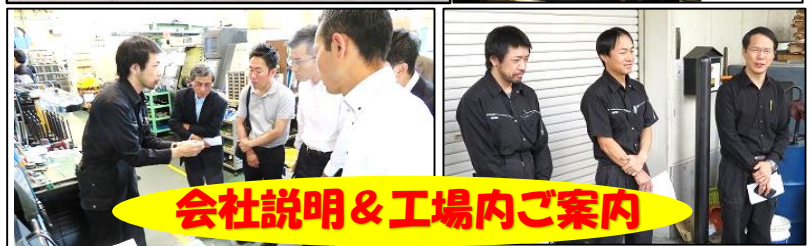
会社説明&工場内ご案内