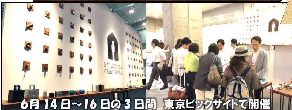
6月14日~16日の3日間 東京ビックサイトで開催

おかげ様で2回目の出展となりました。バイヤー・クリエイターの方々が製品を手にとり興味深げにご覧下さいました。また、「次回も楽しみにしています!」といった声も頂き、ブランドの成長を期待をして下さっているんだと感じました。新たな次のステップに踏み出していける力を頂けた展示会となりました。